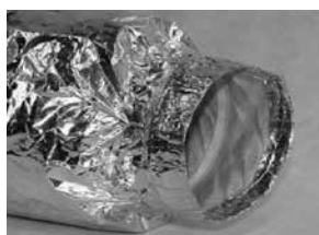
XPA, akoestisch geïsoleerd 1 meter