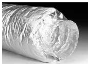
XFFAP, dubbellaags akoestisch geïsoleerd, 1 meter en 0,5 meter