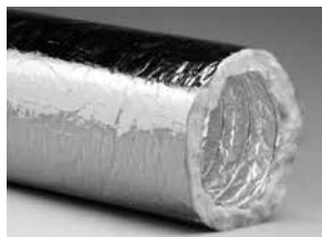
Type XFFAP, akoestisch en thermisch geïsoleerd, 2 laags met folie