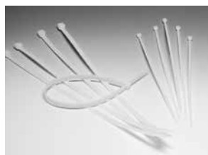
QuickFix Band t.b.v. montage flexibele verbindingen