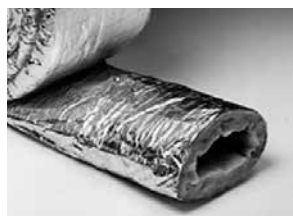
Type XIH, isolatiehoezen met 25 mm isolatie (niet dampdicht)