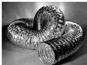
Type XFF, ongeïsoleerd, 2 laags