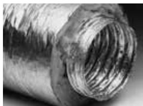
Type XFFT, thermisch geïsoleerd, 2 laags