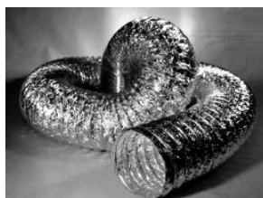
Type XFF, ongeïsoleerd, 2 laags