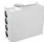
Plenum 12 aansluitingen