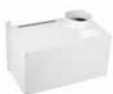
Plenum 8 aansluitingen